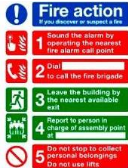
Mae hysbysiadau ymateb tân yn edrych fel hyn