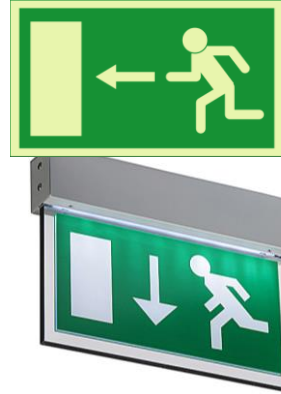
Arwyddion ar allanfeydd tân