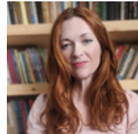
Ms Manon Steffan Ros

Mae Manon Steffan Ros yn nofelydd, dramodydd, sgriptwraig, a cherddor amlwg o Gymru sy'n chwarae rhan arwyddocaol ym myd llenyddol yr iaith Gymraeg. Y llynedd, dyfarnwyd Medal Yoto Carnegie i Manon am ei gwaith 'The Blue Book of Nebo'. Cyfieithiad yw hwn gan yr awdures ei hun o'i nofel, Llyfr Glas Nebo, a enillodd y Fedal Ryddiaith yn Eisteddfod Genedlaethol 2018 a thair Gwobr Llyfr y Flwyddyn.