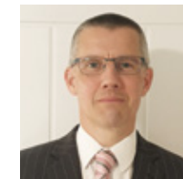
Mr Carl Foulkes

Carl oedd Prif Gwnstabl Heddlu Gogledd Cymru ac arweinydd plismona cenedlaethol Cymru yn ystod Covid. Bu ei ymrwymiad a'i gefnogaeth yn amhrisiadwy i'n partneriaeth wrth sefydlu'r graddau ymarfer plismona proffesiynol. Ef oedd deiliad portffolio cydraddoldeb, amrywiaeth a chynhwysiant Cyngor Cenedlaethol Prif Swyddogion yr Heddlu ac mae ei ymrwymiad i'r egwyddorion hynny'n cyd-fynd yn llwyr ag ymrwymiad y brifysgol.