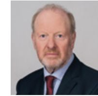
Syr Alan Bates

Er ei fod yn arwr annhebygol, mae Syr Alan Bates , cyn is-bostfeistr o Landudno, wedi ymroi dau ddegawd i eiriol dros gyfiawnder a chlirio enwau rheolwyr Swyddfa'r Post a ddioddefodd yn sgil yr hyn a ystyrir yr achos mwyaf o gamweinyddu cyfiawnder yn hanes y Deyrnas Unedig. Sefydlodd Alan y Gynghrair Gyfiawnder i Is-bostfeistri yn 2009, gan chwarae rhan flaenllaw yn y frwydr gyfreithiol i geisio cyfiawnder i'r rhai yr effeithiwyd arny'n nhw a sicrhau iawndal i'r rhai a gyhuddwyd ar gam. Gyda phump arall o'r Gynghrair Gyfiawnder, aeth â Swyddfa'r Post i'r llys ar ran 555 o hawllyr.